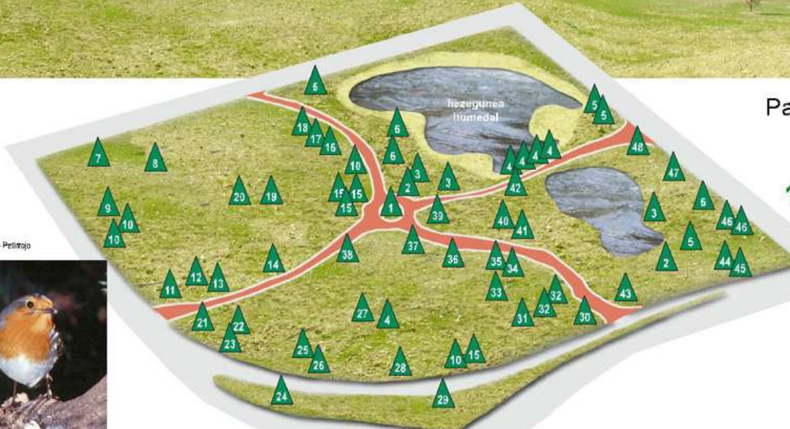
Txiangongoria - Petirrojo

Nota: Este listado muestra una parte de las especies arbóreas del parque.