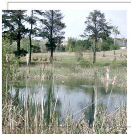
LASARTE-ORIAKO UDALA AYUNTAMIENTO DE LASARTE-ORIA