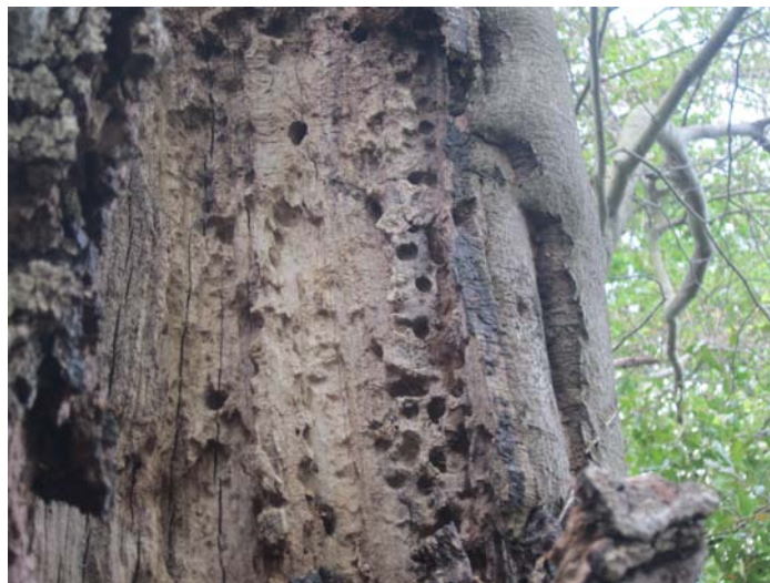
Foto 8. Marcas de larvas de insectos en tronco de haya.

En las visitas realizadas se ha encontrado un haya con signos evidentes de actividad por parte de estos insectos ( Foto 8 ). Se han detectado orificios compatibles con las larvas de algunos de ellos.