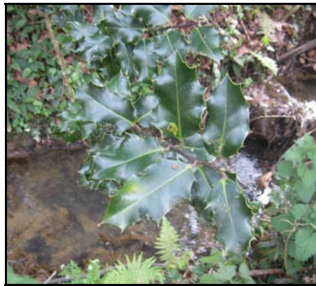
Foto 6. Detalle de un acebo de la zona.

En Errekatxulo se han encontrado algunos ejemplares sobre todo en la zona perimetral del arroyo ( Foto 6 ).