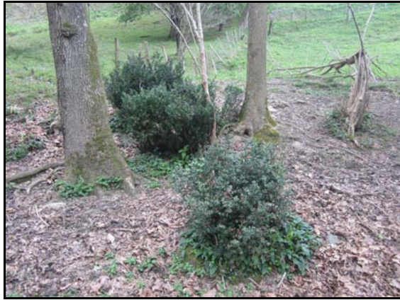
Foto 7. Matas de rusco junto al arroyo.