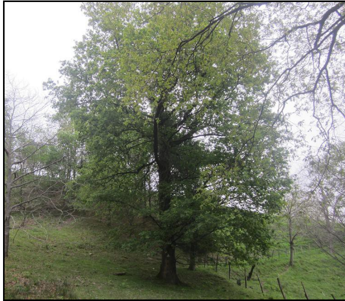
Foto 3. Ejemplar de roble situado en la ladera este.

En este bosque el estrato arbustivo y herbáceo presentan un gran desarrollo y diversidad de especies.