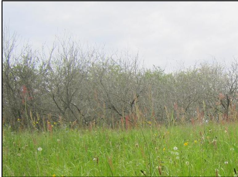
Foto 5. Grupo de manzanos situados en la zona alta del área de estudio.

Estos cultivos aportan variedad al paisaje, constituyen zonas de transición entre los prados y los bosques, e incrementan la biodiversidad del área.