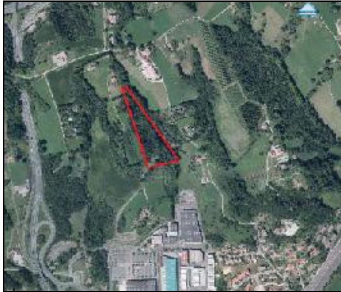
Foto 1. Detalle de la vaguada en rojo al norte del actual polígono Belartza.

El arroyo Errekatzulo, de aproximadamente 500 metros de desarrollo longitudinal en sentido norte sur a lo largo del sector, tal como se apunta en el proyecto de urbanización, se encuentra en estado natural .