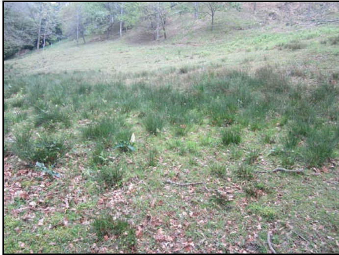
Foto 2. Ejemplo de prado-juncal basófilo atlántico.

Además en los márgenes más cercanos al arroyo (5 metros a cada lado) crecen hileras de alisos y fresnos ( Fraxinus excelsior ). Son los restos de la antigua aliseda que ha quedado relegada a unos pocos ejemplares de esta especie. Aun así, se han contabilizado al menos 30 alisos y 40 fresnos a lo largo de la regata. Destaca también la presencia de acebos ( Ilex aquifolium ) dentro de esta banda.