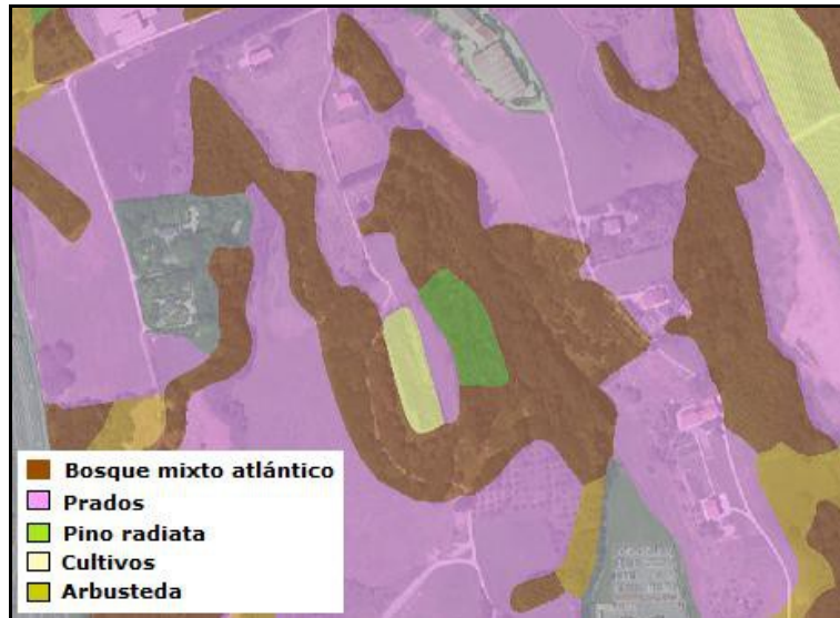
Mapa 2. Mapa de vegetación del área de estudio.

A continuación se describen cada uno de estos tipos añadiendo la información obtenida en las visitas realizadas.