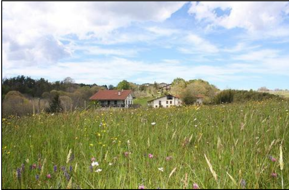
Foto 4. Ejemplo de prado situado en Errekatzulo.