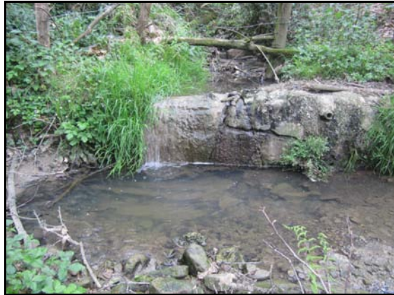
Foto 9. Zona encharcada en el arroyo Errekatxulo.

Al menos se presupone la presencia de la salamandra común ( Salamndra salamandra ), el tritón palmeado ( Lissotriton helveticus ), el sapo partero común ( Alytes obstetricans ) y el sapo común ( Bufo spinosus ) aunque también podrían aparecer otras especies.