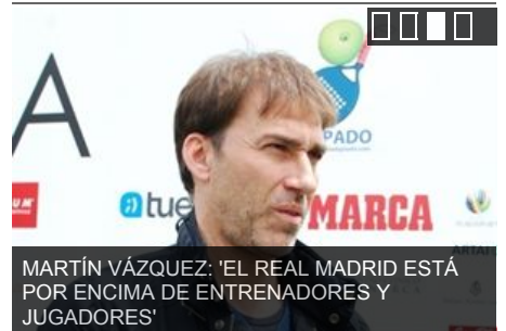
MARTÍN VÁZQUEZ: 'EL REAL MADRID ESTÁ POR ENCIMA DE ENTRENADORES Y JUGADORES'