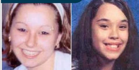
Aparecen vivas tres mujeres supuestamente secuestradas hace diez años en EEUU