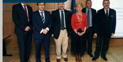
Los ajustes en discapacidad deben hacerse con "solidaridad"