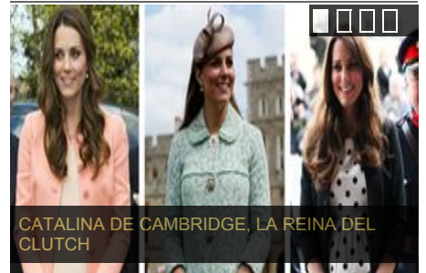
CATALINA DE CAMBRIDGE, LA REINA DEL CLUTCH